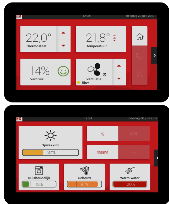
Factory Zero display ZERO™